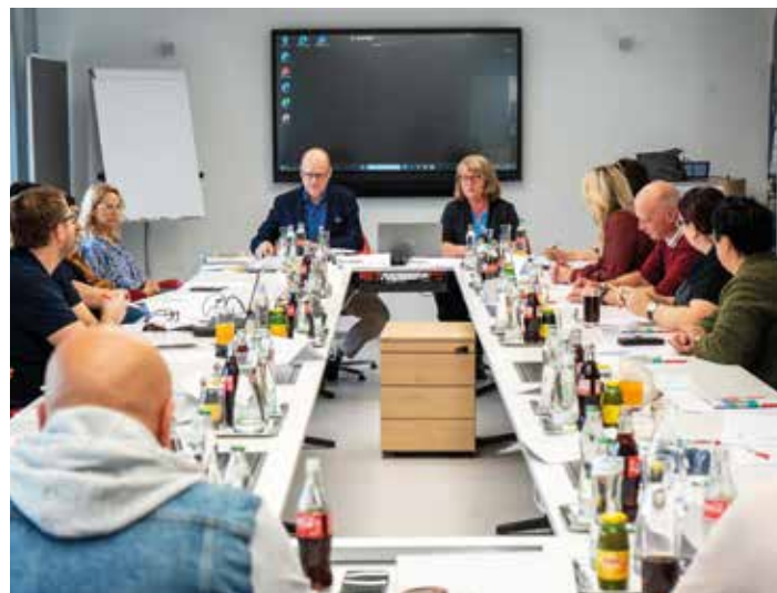
Dertler / AK

D er AK-Arbeitskreis „Gesundheit und Pflege“ besteht aus Fachleuten der AK und aus der Praxis. Es wird versucht, auf Probleme des Arbeitsalltags mit konkreten Verbesserungsvorschlägen zu reagieren.