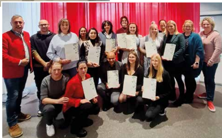
Bildungszentrum für Pflege und Gesundheit Ost (2)

Die Zeit der Ausbildung ist vorbei, hinein ins Berufsleben! Die Arbeiterkammer gratuliert herzlich und versichert, auch künftig mit Rat und Tat zu unterstützen, sollte es Probleme geben. Einsendungen an: redaktion@akstmk.at