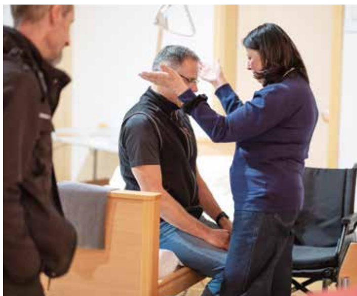
Graf-Putz / AK

Angesichts der nach wie vor schwachen Konjunktur wären genau jetzt gezielte Investitionen in Gesundheit und Pflege die richtige Antwort – sozial, wirtschaftlich und menschlich.