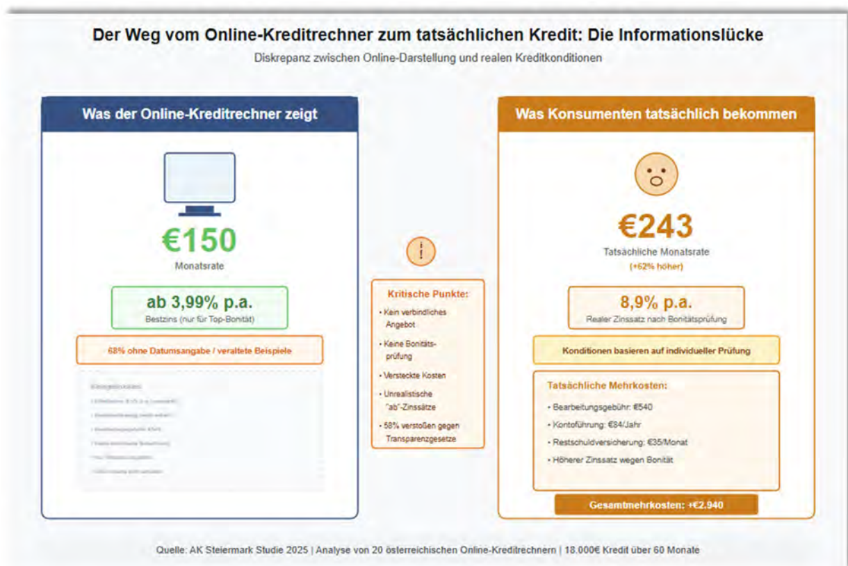
Abbildung 16 Empirische Analyse zeigt durchschnittlich 62% höhere Realkosten als in Online-Kreditrechnern dargestellt – basierend auf 20 untersuchten österreichischen Banken. 41 Banken deklarieren den Kreditrechner lediglich als „Orientierungshilfe“ und als „Marketinginformation“, wohingegen Verbraucher innerhalb dieser Informationen ernst nehmen.

Alle Kreditrechner müssen die WCAG 2.1 Level AA erfüllen und in den relevanten Migrantensprachen verfügbar sein. Mit 27,8% Menschen mit Migrationshintergrund in Österreich 40 und dem verfassungsrechtlichen Gleichheitsgrundsatz nach ist der aktuelle Ausschluss dieser Bevölkerungsgruppen von transparenter Kreditinformation inakzeptabel.