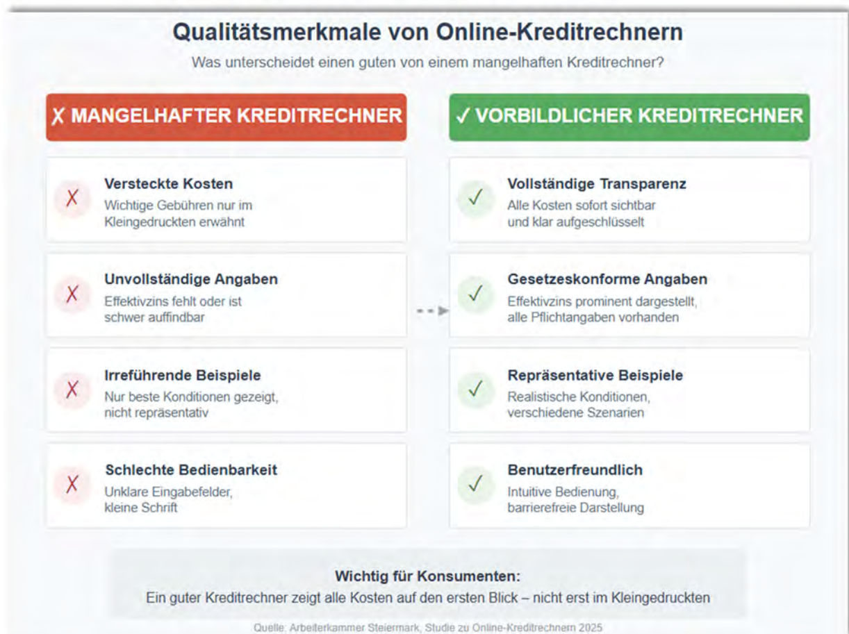
Abbildung 15: Systematische Gegenüberstellung von Transparenzdefiziten und Best-Practice-Merkmalen bei Online-Kreditrechnern österreichischer Banken